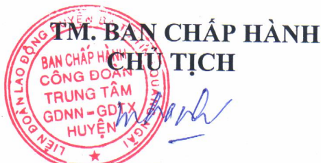
Trần Ngọc Thanh

Điều 19: Trong quá trình thực hiện nếu có điều nào cần điều chỉnh, bổ sung thì báo cáo cùng phối hợp sửa đổi cho phù hợp với tình hình thực tiễn tại đơn vị.